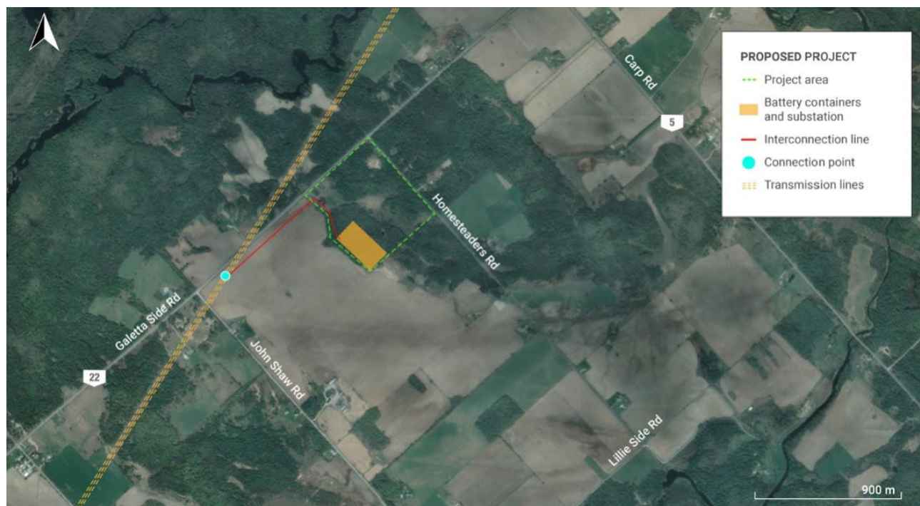
CARTE PRÉLIMINAIRE du projet de stockage d'énergie par batteries Fitzroy