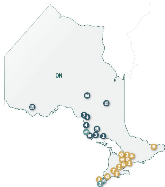
Présence d'Evolugen en Ontario

Evolugen s'emploie à instaurer la confiance en dialoguant proactivement avec les communautés pour nous assurer que leurs intérêts sont adéquatement pris en compte dans notre processus décisionnel. En plus de collaborer en matière d'environnement, de santé, de sécurité et d'interventions en cas d'urgence, nous soutenons des projets locaux, offrons des opportunités d'activités récréatives et travaillons étroitement avec nos partenaires régionaux afin d'avoir un effet positif qui s'harmonise à la fois avec les besoins des communautés et nos valeurs d'entreprise.